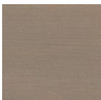
1142 Графит серебро