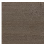
1143 Оникс серебро